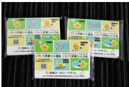
ポケットティッシュ