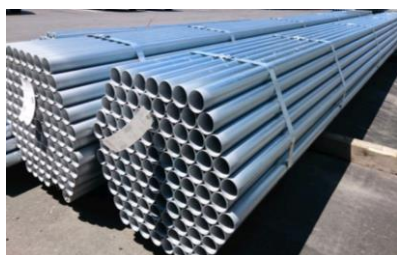
単管パイプ (1 m)